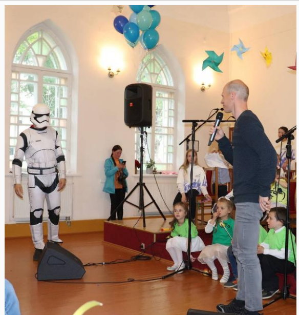
Kartu su Robiu