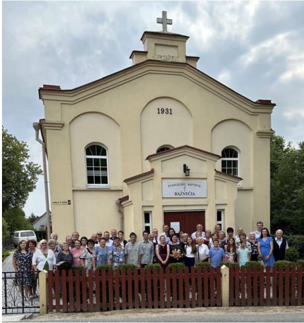
Bendruomenė su svečiais po metinės šventės 2023 m.

Jei Viešpats leis, planuojami tokie bendruomenių ir Sąjungos renginiai: