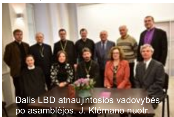
Dalis LBD atnaujintosios vadovybės po asamblėjos.